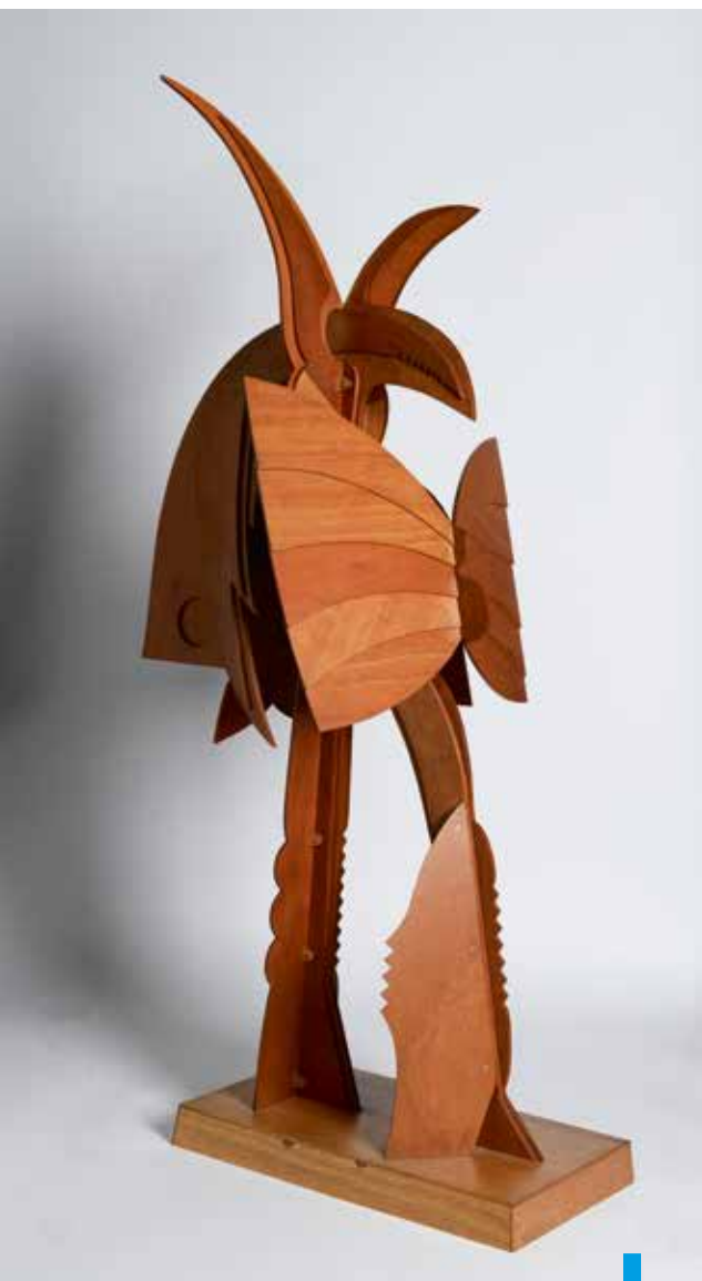
Shinkichi Tajiri, 'Ronin', 1999, multiplex (model), h. 128 cm, Shinkichi Tajiri Estate [V]

'Gimme Shelter', 30 mei t/m 20 september, Kunstfort Asperen: 'Brief aan mijn vijand'; Fort Nieuwersluis: 'Verborgene Krachten'; Kunstfort Vijfhuizen: 'Strijdtoneel'; wo t/m zo 11-17; toegang € 6,00 (per fort); catalogus € 6,00; gimme-shelter.nl • Kunstfort Asperen, Langendijk 60, Acquoy; kunstfortasperen.nl • Fort Nieuwersluis, Rijksstraatweg 7b, Nieuwersluis; fortnieuwersluis.nl • Kunstfort bij Vijfhuizen, Fortwachter 1, Vijfhuizen; kunstfort.nl