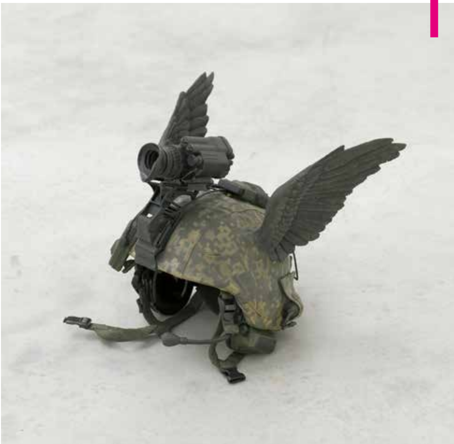
Allora & Calzadilla, 'The bird of Hermes is my name, eating my wings to make me tame', 2010, beschilderd brons, 60 x 50 x 40 cm (N)

den inmiddels al meer dronepiloten opleid dan conventionele vliegers. De toekomst is aan de onbemande bommenwerper.