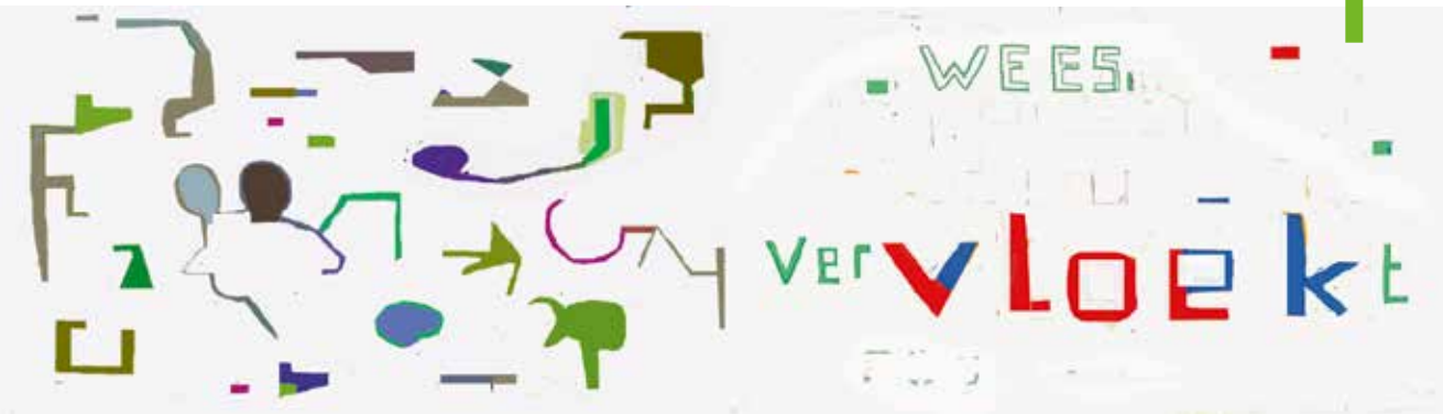
Jos Houweling, 'Dit moet pijn doen', 2015, video, 25' (A)