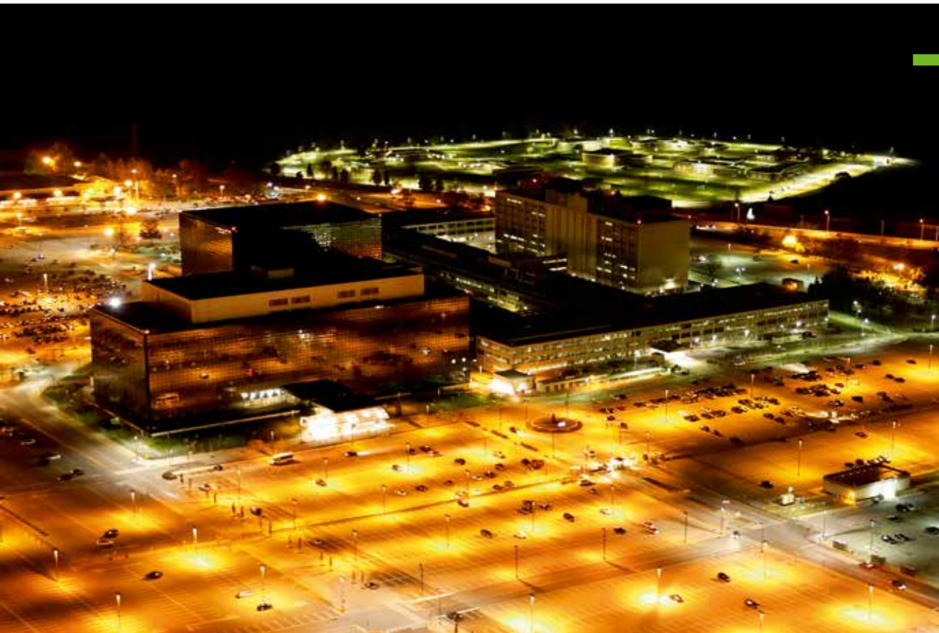
Trevor Paglen, 'Headquarters of the National Security Agency on Fort Meade, Maryland', 2013, luchtfoto in opdracht van Creative Time Reports (A)