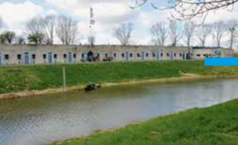
Kunstfort Vijfhuizen (V)