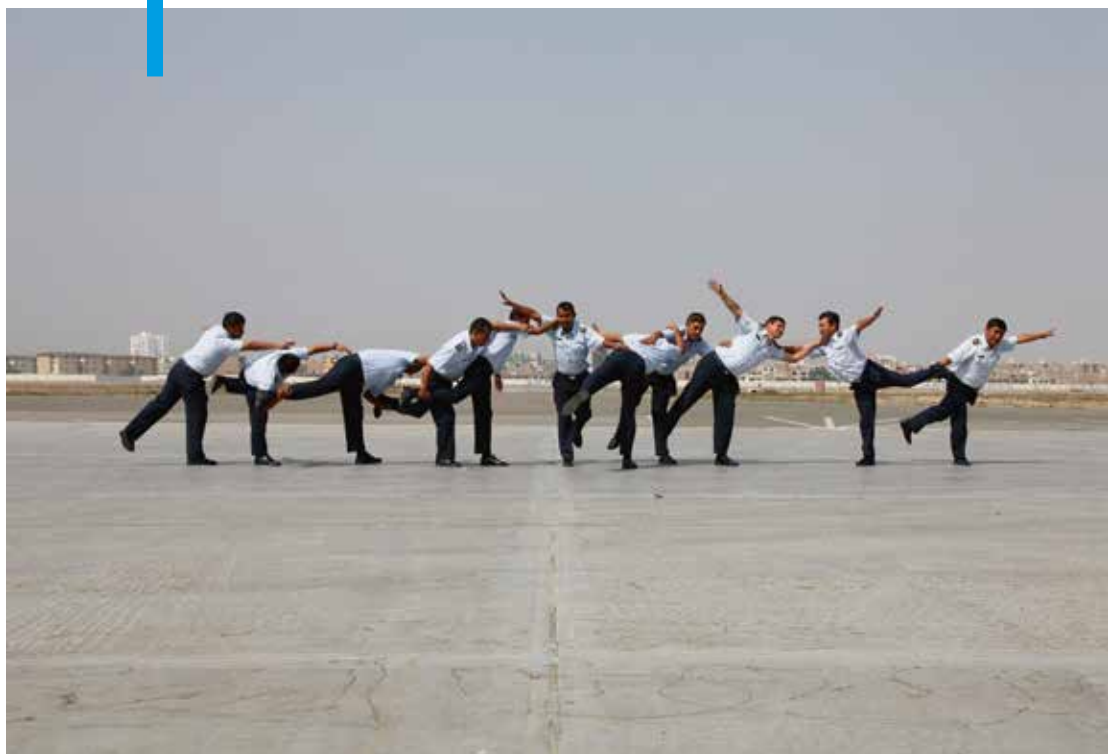
Fernando Sanchez-Castillo, 'Stone Soul Army', 2013, HD-video, 29'37" [V]