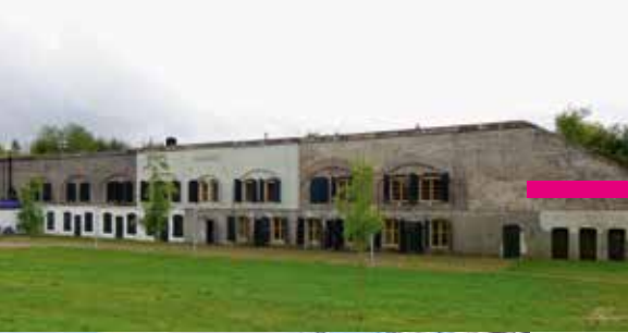
Fort Nieuwersluis (N)