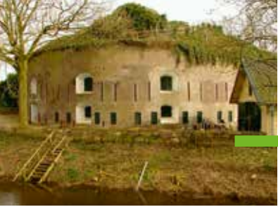
Kunstfort Asperen (A)